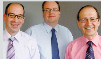
Geschäftsleitung der Inspirion